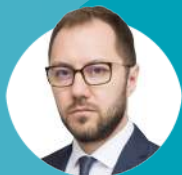
Рахматуллин А. Р. министр здравоохранения Республики Башкортостан